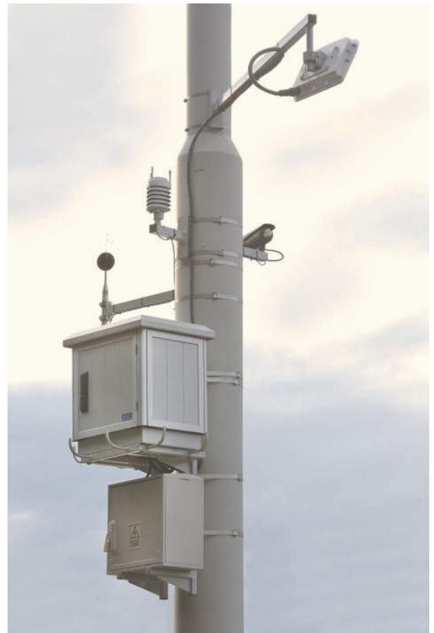
ENVIRO-151 w wersji stacjonarnej