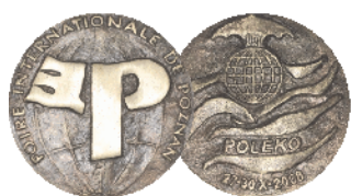
Złoty medal MTP POLEKO