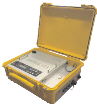
ENVIRO-151 w wersji przenośnej